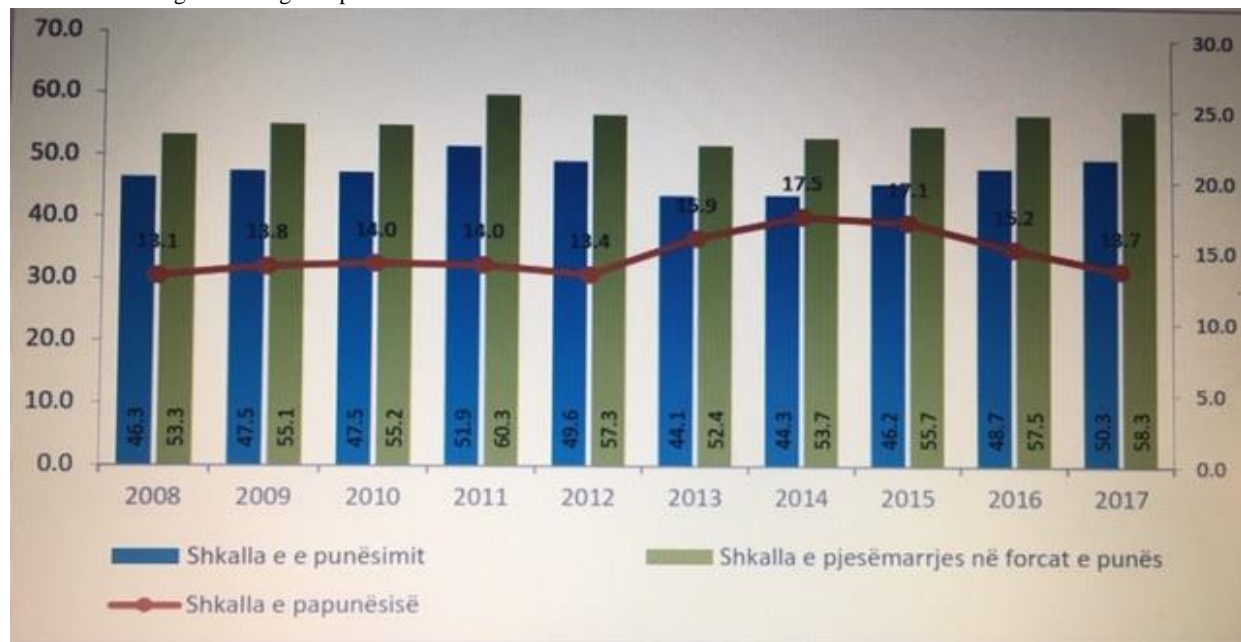
Grafiku 1 Mbi treguesit e tregut të punës